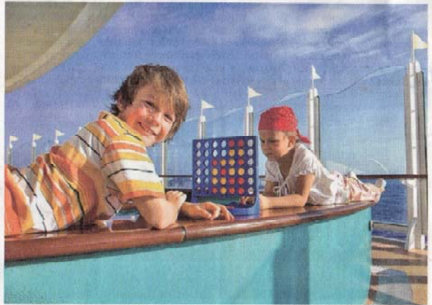
Eine Kreuzfahrt ist eine Reise für die ganze Familie - mit Spiel und Spaß für alle.