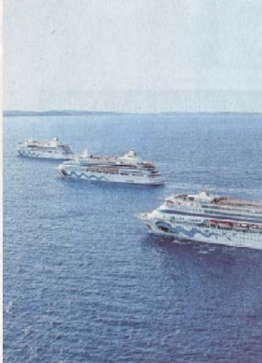
It einem Kreuzfahrtschiff auf Reisen gehen - für viele ein um, der einmal im Leben erfüllt werden soll.